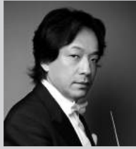
指揮: 沼尻竜典 Conductor: Ryusuke Numajiri

1946年、東宝交響楽団として創立。1951年に東京交響楽団に改称し、現在に至る。2004年7月より、川崎市のフランチャイズオーケストラとしてミュージア川崎シンフォニーホールを拠点に定期演奏会や特別演奏会を開催するほか、市内での音楽鑑賞教室や巡回公演、川崎フロンターレへの応援曲の提供など多岐にわたる活動を行う。これらが高く評価され、2013年に第42回川崎市文化賞を受賞。また、文部大臣賞、京都音楽賞大賞、毎日芸術賞、サントリー音楽賞など日本の主要な音楽賞の殆どを受賞している。新国立劇場では1997年の開館時からレギュラーオーケストラとして毎年オペラ・バレエ公演を担当。教育面でも「こども定期演奏会」「0歳からのオーケストラ」が注目されている。海外公演も多く、これまでに58都市78公演を行っている。音楽監督にジョナサン・ノット、正指揮者に飯森範親、桂冠指揮者に秋山和慶、ユベール・スダーン、名誉客演指揮者に大友直人を擁する。2016年に創立70周年を記念し、ウィーン楽友協会を含むヨーロッパ5カ国で公演を行う。また2018年8月には日中平和友好条約締結40周年を記念し上海・杭州にて公演を行い、日中の文化交流の役割を果たした。公式サイト http://tokyosymphony.jp/