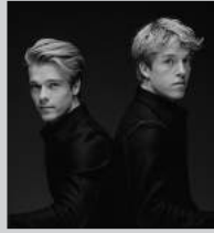
ピアノ: ユッセン兄弟 (アルトゥール・ユッセン & ルーカス・ユッセン) Piano: Arthur Jussen & Lucas Jussen

びわ湖ホール芸術監督、トウキョウ・ミタカ・フィルハーモニア音楽監督、リュベック歌劇場首席客演指揮者(2018/19年シーズンまで)。1990年プザンソン国際指揮者コンクール優勝。ロンドン響、モントリオール響、ベルリン・ドイツ響等各国のオーケストラを指揮。国内ではN響を指揮してのデビュー以来、数々のオーケストラのポストを歴任。オペラ指揮者としてはケルン、ミュンヘン、ベルリン、パーゼル等の歌劇場にも客演を重ねている。2017年紫綬褒章受章。