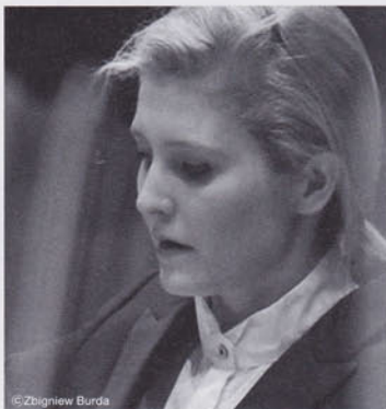
指揮：パトリチア・ピツァア Conductor: Patrycja Pieczara

東響首席客演指揮者ウルバンスキと同門のピツァアは、日本初登場の指揮者。イブラギモヴァはスターへの階段を駆け上がる勢いのあるヴァイオリニストの一人。古典派、ロマン派の名作を、若き女流音楽家とともに贈ります。