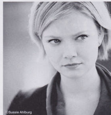
ヴァイオリン：アリーナ・イブラギモヴァ Violin: Alina Ibragimova

ポーランド・クラクフ生まれ。2011年ポーランド国立放送響とクラクフ・フィルを指揮してデビュー、その後様々な地域で活躍の場を拓いている。2014年よりポズナン・グランド・シアターの副指揮者を務めている。ペンデレツキ夫妻によって設立されたベートーヴェン・アカデミー・オーケストラと共にF.シャルヴェンカの数作品を初演するなど、注目の若指揮者である。